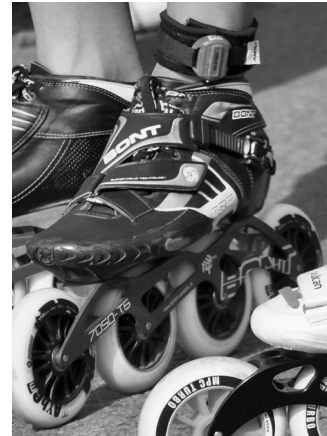
Obrázek č. 1 (připevnění čipu)