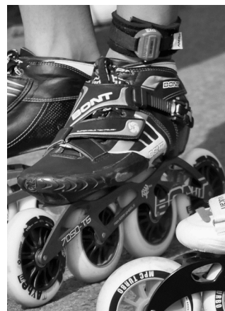
Obrázek č. 1 (připevnění čipu)

Všichni závodníci jsou povinni mít na hlavě přilbu!